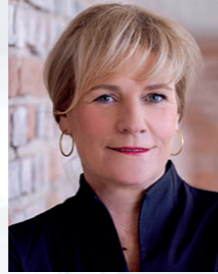
Simone Oldenburg, Ministerin für Bildung und Kindertagesförderung

am 9. Juni 2024 findet die Wahl zum Europäischen Parlament statt. In ganz Mecklenburg-Vorpommern sind alle Bürgerinnen und Bürger ab 16 Jahren dazu aufgerufen, ihre Stimme bei der Wahl abzugeben.