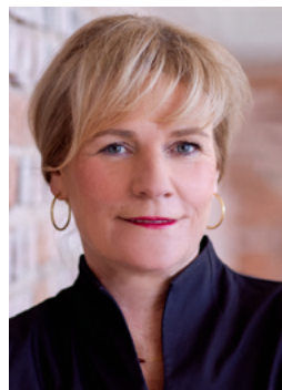
Simone Oldenburg Ministerin für Bildung und Kindertagesförderung

Mecklenburg-Vorpommern Ministerium für Bildung und Kindertagesförderung