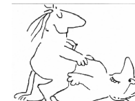
Vaginalverkehr ohne Kondom ☞