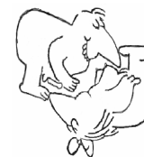
Oralverkehr ohne Kondom ☞