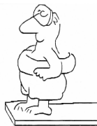
Schwimmbad / Sauna ☞