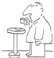
Tassen / Gläser ☞