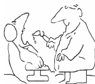
Zahnarzt / Arzt ☞