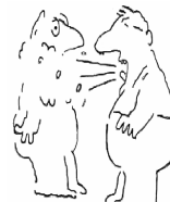
Anhusten / Anniesen ☞