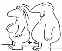
Analverkehr ohne Kondom ☞