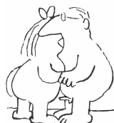
Küssen / Petting ☞