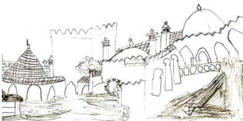
Illustration von Clemens

Tanger, Geschichte des Knaben, der vor der Kirche verwaarloste junge Leute kennen gelernt, die von Tanger schwärmen und in dem Knaben den Wunsch wecken, mit ihnen dorthin zu fahren. Er liest in einem alten Baedeker, in einem alten Lexikon die Abschnitte über Tanger. Häuslicher Kummer und Unverständnis. Der Junge will mit seiner Freundin fliehen. Er verbringt mit ihr die Nacht bei den Verwaarlosten. Schreck einer Polizeisirene. Die Kinder gehen nach Hause. Der Vater des Jungen ist auch in Afrika gewesen. Er zeigt dem Sohn sein Bild in der Uniform des Afrikakorps. Der Knabe will nicht in der Uniform reisen. Lieber als Vogelscheuche. Aber im Bett erkennt er, es gibt das Afrika Karl Mais, das Afrika des Geographiebuches, das des Baedeker und des Lexikon, vielleicht gibt es auch das Tanger seiner Freunde, aber sein eigener Traum von diesem Tanger ist ein unerreichbarer.