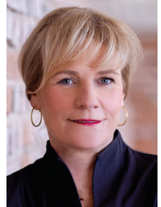
Simone Oldenburg Ministerin für Bildung und Kindertagesförderung